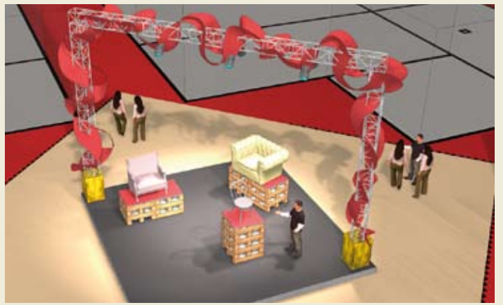
10 / ESPOSIZIONE CORALE PADIGLIONI A-E-C "LA STORIA DEL DESIGN INTERNAZIONALE"