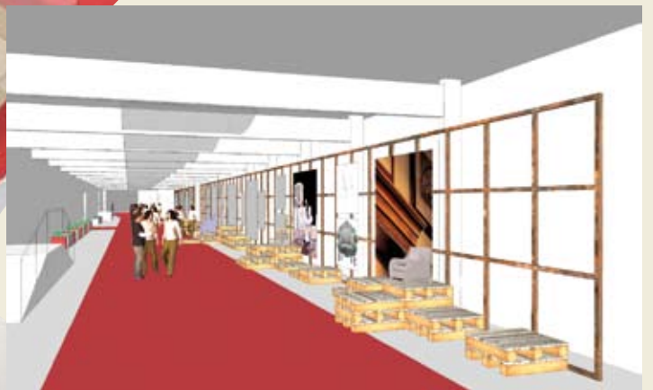
6 / CORRIDOIO K - MOSTRA CLASSICO ARTISTICO