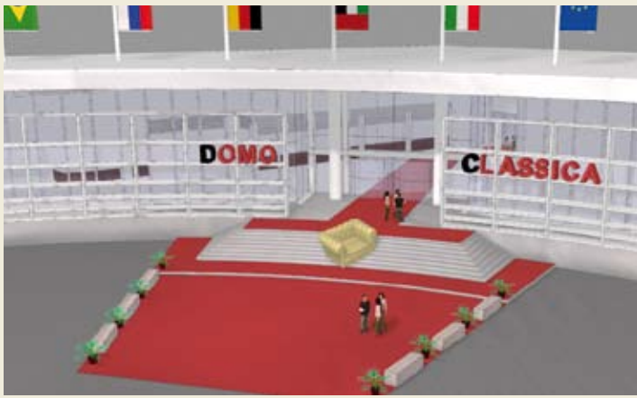
1 / INGRESSO DELLA FIERA